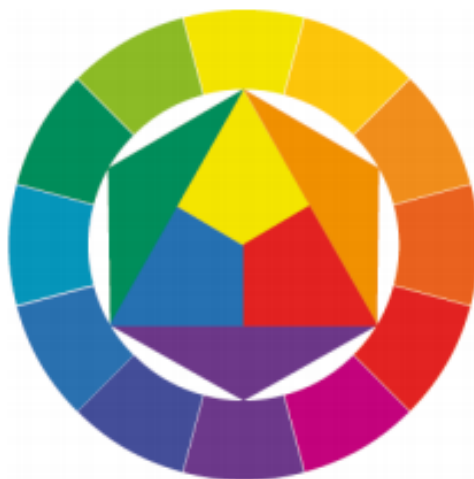
Мал. 2. Коло кольорів Йоганнеса Ітена 1 .

Можна використовувати і коло кольорів Йоганнеса Ітена (мал. 2).